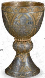
Der Tassilo-Kelch, dem Kloster Kremsmünster gestiftet von Tassilo und seiner Gemahlin Liutperga

Eine schwere Hungersnot bedroht das Reich. Karl erlässt ein Kapitular mit einem Fastengebot und Anordnung zur Ernährung der Hungernden.