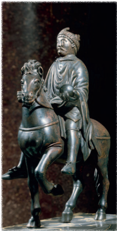
Reiterstandbild Karls des Großen. Karolingische Plastik aus Bronze, um 870. Es kommt der Beschreibung Einhardts ziemlich nah.