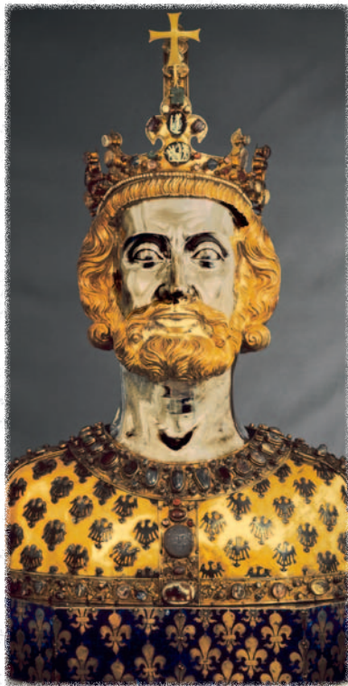
Büstenreliquiar Karls des Großen aus dem Aachener Domschatz. 1349 gestiftet von Karl IV.