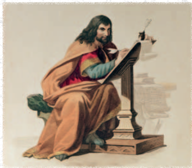
Einhard, wie ihn sich die Romantiker im 19. Jh. vorgestellt haben (Stich nach Dupré)

War ein langobardischer Geschichtsschreiber und Mönch. 782 kam er als Lehrer an die Hofschule Karls des Großen. Er hinterließ ein unvollendetes Kompendium über die Geschichte der Langobarden.