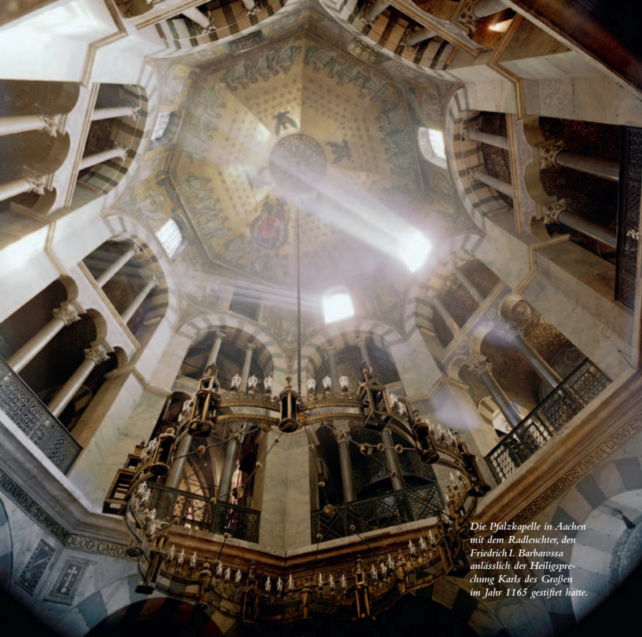
Die Pfalzkapelle in Aachen mit dem Radleuchter, den Friedrich I. Barbarossa anlässlich der Heiligspredigung Karls des Großen im Jahr 1165 gestiftet hatte.