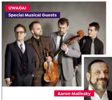
UWAGA! Special Musical Guests