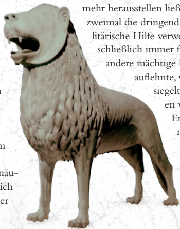
Der Braunschweiger Löwe, um 1166

Sohn des Welfenherzogs Heinrich des Stolzen und der Kaisertochter Gertrud von Sachsen. Barbarossas Vetter war einer der mächtigsten Territorialfürsten in ganz Europa. Er hatte in zweiter Ehe die Tochter des englischen Königs Heinrichs II. geheiratet, was ihn seinen Anspruch auf Gleichrangigkeit mit seinem kaiserlichen Vetter noch mehr herausstellen ließ. Als er Barbarossa zweimal die dringend erforderliche militärische Hilfe verweigerte und sich schließlich immer fordernder gegen andere mächtige Reichsfürsten auflehnte, war sein Fall besiegelt. Seine Territorien wurden aufgeteilt. Er musste ins Exil nach England.