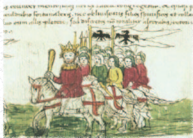
Barbarossa auf dem dritten Kreuzzug, lat. Manuskript, 15. Jhd. (Venedig, Biblioteca Nazionale Marcian)

Papst seit Dezember 1187. Unterstützte auf Sizilien den Usurpator Tankred von Lecce gegen die rechtmäßige Erbin Konstanze und deren Mann Heinrich VI., Sohn Barbarossas.