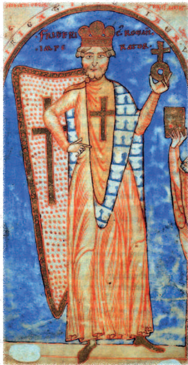
Barbarossa in einer Miniatur aus einer Handschrift von 1188, Vatikanische Bibliothek

Bürgerlich: Johannes von Struma. Musste sich nach dem Friedensschluss von Venedig 1177 Papst Alexander III. unterwerfen. Er wurde von ihm begnadigt und beschloss seinen Lebensabend auf seinen ihm vom Papst übertragenen Kirchengütern in Benevent. Ein vierter und letzter Gegenpapst, Innozenz III., konnte sich ebenfalls nicht mehr durchsetzen und starb im Gefängnis.