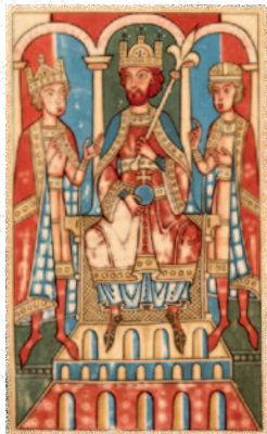
Barbarossa und seine Söhne Heinrich VI., der bereits die Königskrone trägt (links), und Friedrich (Ausschnitt einer zeitgenössischen Miniatur aus der Welfenchronik)

25. Juni: Friedensvertrag von Konstanz. Beilegung des Konflikts mit dem Lombardenbund.