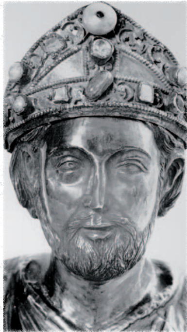
Reinald von Dassel, Skulptur vom Dreikönigsschrein im Kölner Dom, (Nikolaus von Verdun und Werkstatt, um 1190)

Erzbischof von Mainz ab 1160. Reichskanzler ab 1162 (Nachfolger Reinalds von Dassel). Begabter Feldherr und Militärstrategie. War maßgeblich an der Versöhnung Friedrichs I. Barbarossa mit Papst Alexander III. beteiligt.