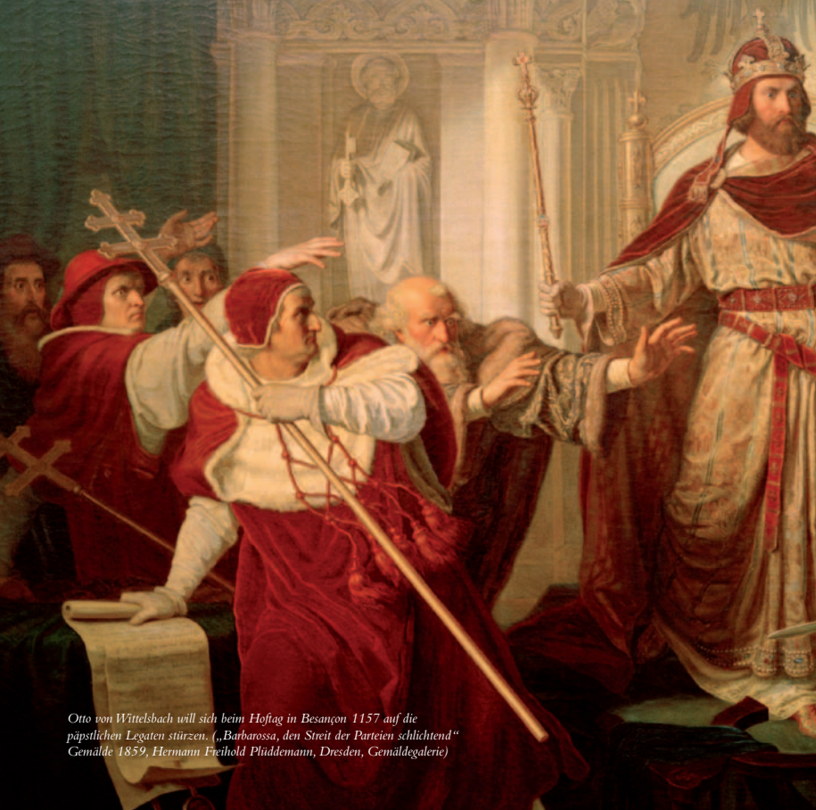
Otto von Wittelsbach will sich beim Hoftag in Besançon 1157 auf die päpstlichen Legaten stürzen. („Barbarossa, den Streit der Parteien schlichtend“ Gemälde 1859, Hermann Freihold Plüddemann, Dresden, Gemäldegalerie)